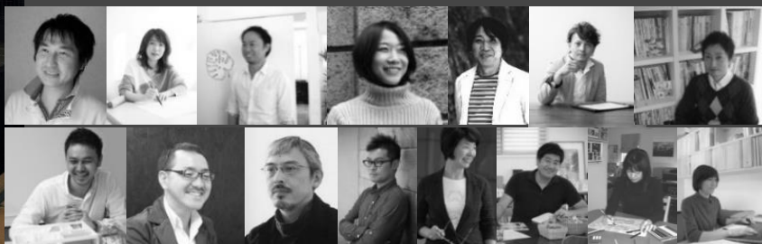
R+house アトリエ建築家「マイスターズクラブメンバー」